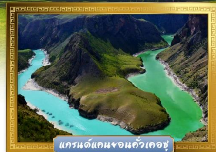
แกรนด์แคนยอนกัวเคอซู

เดินทางโดย : สายการบินโซนาเซาเทิร์นแอร์ไลน์