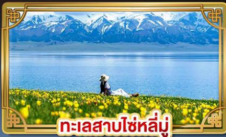
ทะเลสาบไซหลี่มู่