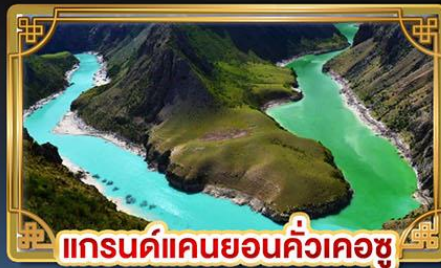
แกรนด์แคนยอนคั่วเคอซู