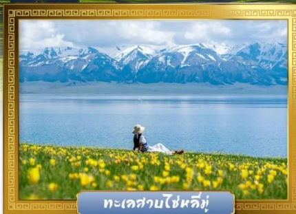
ทะเลสาบไซหลิมู่