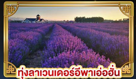
ทุ่งลาเวนเดอร์อีพาอ้อฮัน